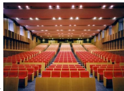
名城ホール会場 (会場内は飲食禁止)

「名城食堂」共通講義棟北 B1 営業時間 11:00～14:00 「カーサ」・「生協店舗」タワー75 1F 営業時間 10:00～15:00